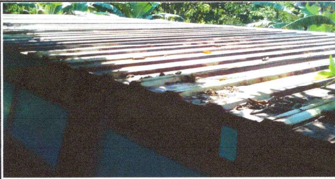
Foto1: Cambio de pintura de costaneras.